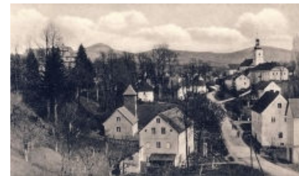
Przedwojenna panorama Jaszkowej Górnej