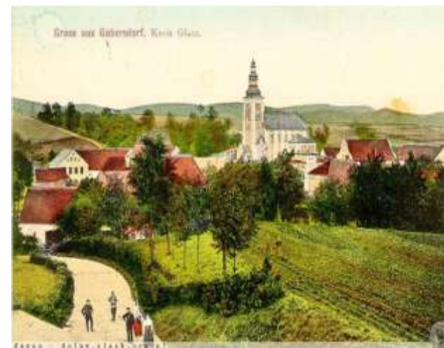
Panorama Wojborza z 1910 r.