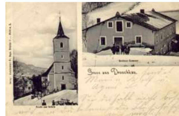
Przedwojenna panorama Droszkowa https://polska-org.pl/747048,foto.html?idEntity=504604