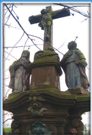
1. Grupa figuralna Ukrzyżowanie