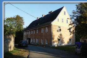
10. Dawna szkoła