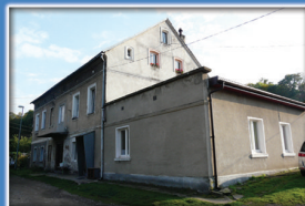
11. Dawna gospoda