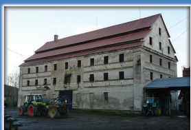
6. Dawny spichlerz w folwarku dolnym