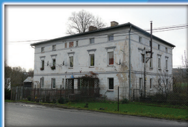
7. Dawny dwór w folwarku dolnym