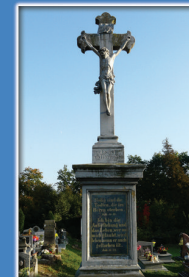
14. Kamienna Pasja na cmentarzu