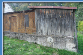
8. Religijne symbole na budynku