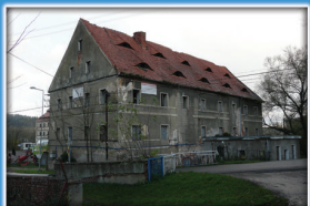
5. Dawny młyn w folwarku dolnym