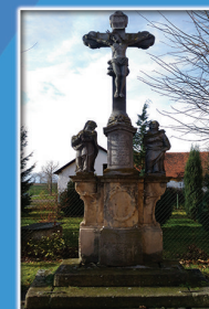
16. Grupa figuralna Ukrzyżowanie