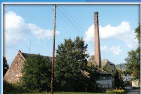
4. Dawna gorzelnia w folwarku dolnym