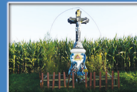
13. Kamienna Pasja