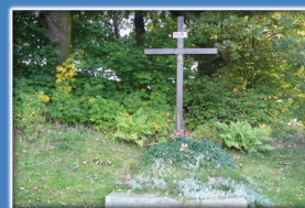
12. Drewniana Pasyjka