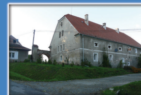
15. Zabudowania dawnego folwarku górnego