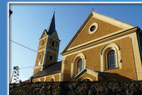
17. Kościół p.w. św. Jana Chrzciciela