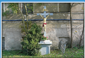
3. Kamiena Pasja