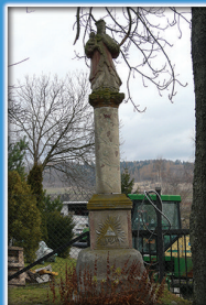
2. Kolumna maryjna